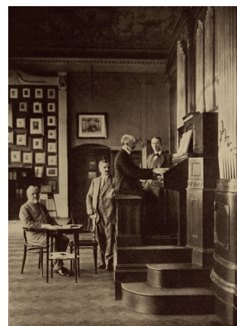
Der Organist Alfred Hollins (Edinburgh) 1913 an der Aufnahmeorgel Welte-Philharmonie Typ IVb am Firmensitz Freiburg im Breisgau.