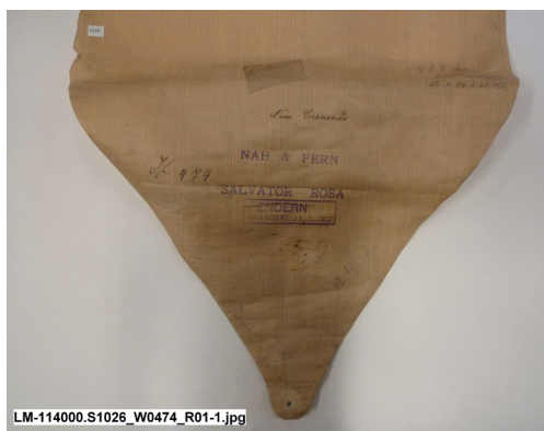
Vorspann der Orgel-Aufnahmerolle 474: Nah und fern aus der Oper Salvalor Rosa von A. C. Gomes, Interpret: Fr. Philipp, vor 1911, mit internen Firmenmarken.